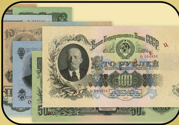
Денежная реформа (1947)