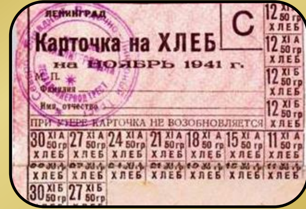
Отмена карточной системы (1947)