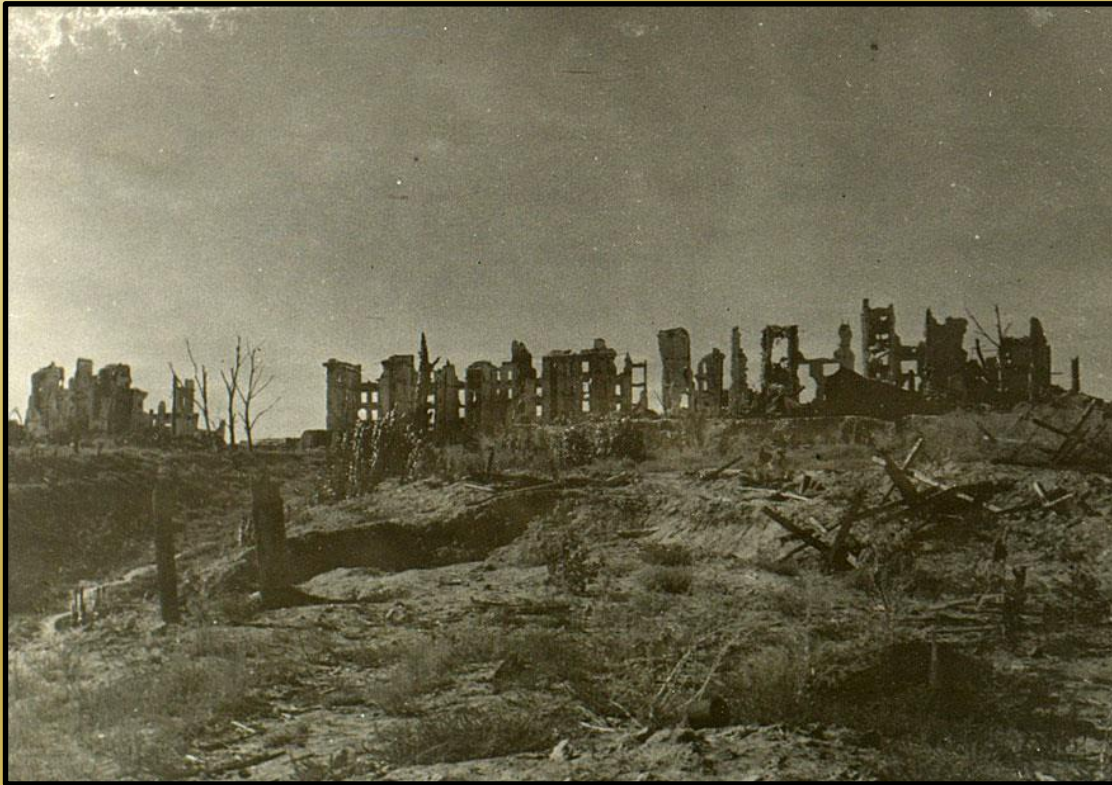
Разрушенный войной город

Урон , который был нанесен Советской экономике, огромен и ужасен. По официальным данным Советский Союз потерял около трети своего довоенного достояния: