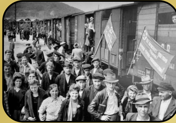
Репатриация советских граждан