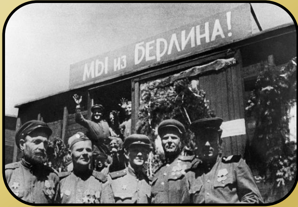
Демобилизация в армии и на флоте